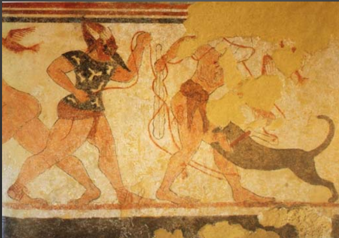
Détail paroi droite