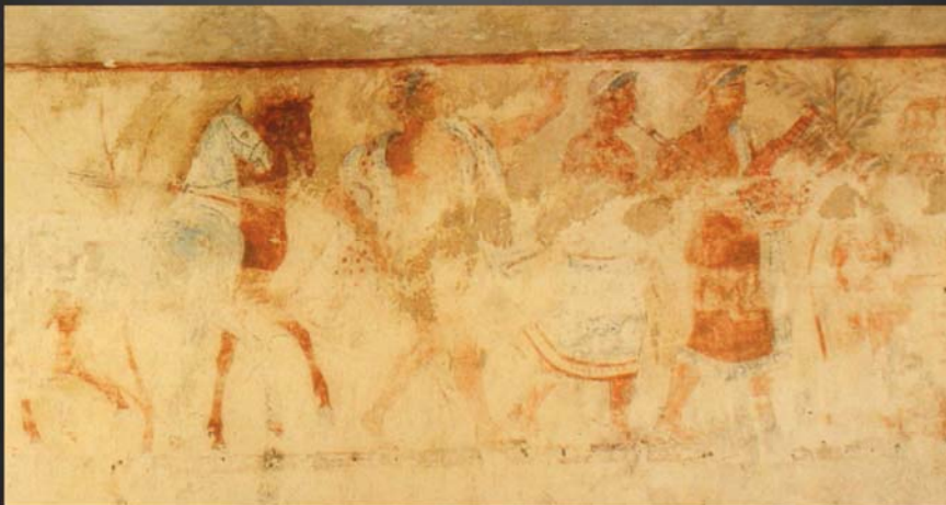
Tombe des Démons Bleus – détail paroi de gauche