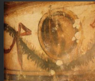
Tombe des Guirlandes (Tarquinia)