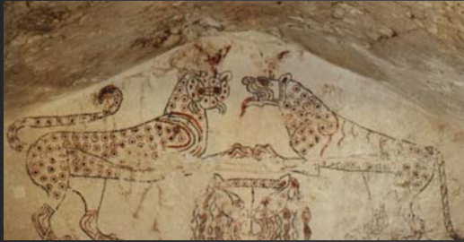
Tombe des panthères (Tarquinia)