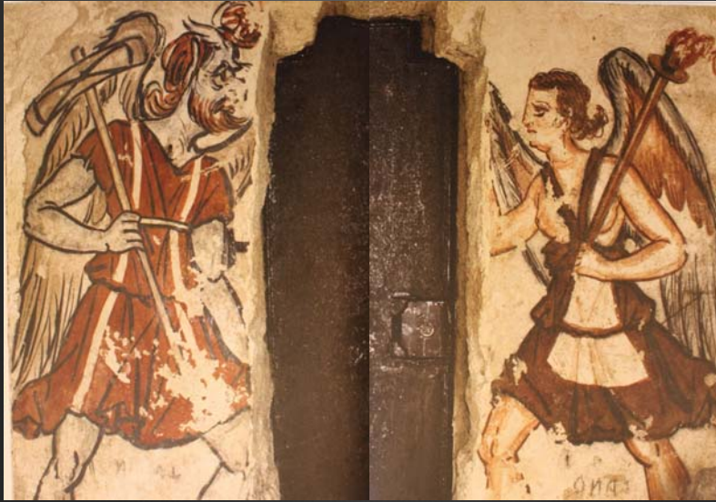
Tombe des Anina (Tarquinia)